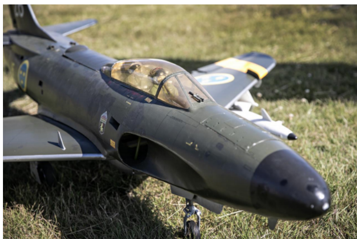
En utav två kända flygande modeller i världen av stridsflygplanet Saab 32 Lansen.

– Det är spännande. Det är många system som ska funka, det går fort och ger lite adrenalin. Det låter och luktar flygfotogen. Och så är det ganska mycket pengar som flyger runt. Kanske 35 000 kronor för den där, säger han och pekar på Lansen.