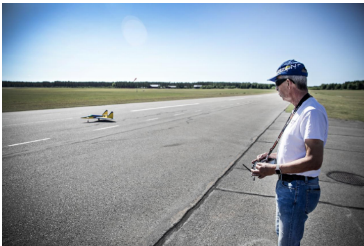
"Det flyger väldigt bra. Går stadigt i luften och når kanske 200 kilometer i timmen."